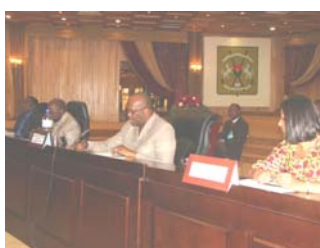
Le preasidium à l'ouverture

Cette rencontre de haut niveau a été précédée par des réflexions sur la thématique de la politique de sécurisation foncière en milieu rural et une communication