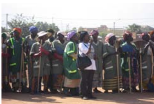
Femmes de la brigade verte

120 kilomètres de voies bitumées et environ 3 000.000 mètres carré de domaine public sont nettoyés chaque Lundi et chaque Jeudi.