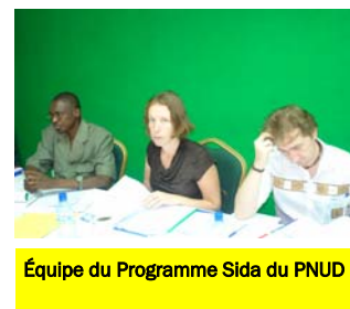
Équipe du Programme Sida du PNUD

cité et de l'exécution de l'aide, le Burkina Faso a été choisi avec quatre autres pays pour mettre en place ce plan, dont un atelier devrait le valider d'ici le mois de juin. JPT