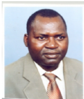
Le Coordonnateur du Programme

L'état des lieux de la décentralisation a fait ressortir de nombreuses faiblesses. Parmi les faiblesses, on peut relever : (i) la faible mobilisation de ressources par les collectivités territoriales, (ii) l'arrivée massive de plus de 18 000 élus locaux dont la plupart sont analphabètes, (iii) la méconnaissance par les élus locaux de leurs rôles, (iv) la faible implication des organisations de la société civile et des populations locales dans la gestion des affaires locales, (v) les insuffisances d'outil d'aménagement du territoire et de planification locale, (vi) les ressources humaines et financières limitées du MATD qui éprouve des difficultés à jouer son rôle de