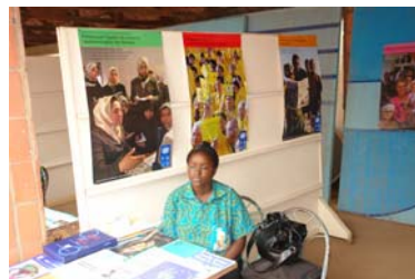
Une vue du stand du PNUD

La cérémonie de lancement a été présidée par le ministre de la promotion, Mme Gisèle Guigma. Pour l'occasion, il a été présenté au public, l'œuvre de