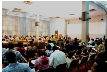
La revue a connu une grande participation

1. les opportunités d'emploi et d'activités génératrices de revenus notamment pour les jeunes et les femmes sont élargies d'ici 2010 ;