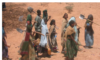
Vers une expansion des villages du millénaire

Le rôle du PNUD doit aussi être vu dans ce contexte comme une partie d'une stratégie globale de développe-