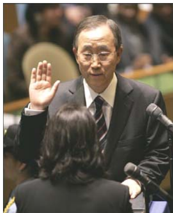
Le Secrétaire Général des Nations Unies

65 millions de personnes ont été infectées par le VIH à travers le monde depuis 1981 avec un chiffre macabre de 25 millions de morts. Aujourd'hui, 40 millions de personnes vivent avec le VIH, dont la moitié sont des femmes. Le traitement sous