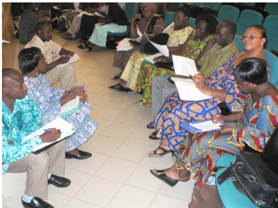
Groupe de travail

En 2005, ONU Habitat en partenariat avec l'Alliance pour le Genre et l'Eau avait initié une Evaluation Participative Rapide du Genre dans 17 Villes africaines dont Ouagadougou (Burkina Faso). Cette évaluation avait éveillé les consciences des acteurs locaux, des praticiens et opérateurs sur le besoin d'intégrer le Genre dans la fourniture des services d'eau et d'assainissement.