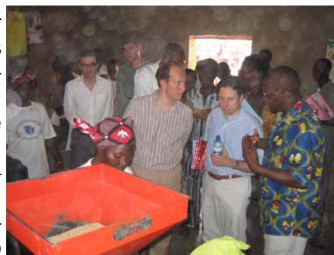
Visite de la Plateforme de Poa

giées par les chargés de programme. En dépit de remarques des coordonnateurs sur les délais trop longs pour payer directement un fournisseur, le PNUD s'est engagé à