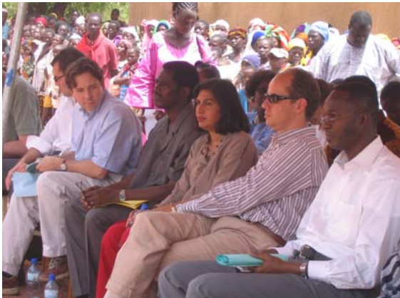
De la droite vers la gauche, le Ministre Bouda, le Ministre luxembourgeois et Mme la Directrice du PNUD

de proposition de solutions pour les résoudre, de fixation d'objectifs à atteindre.