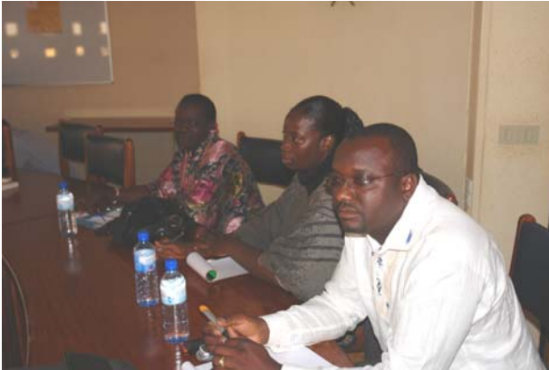
La délégation du CIC-DOC

Ces séances avaient pour but de faire connaître beaucoup de choses aux