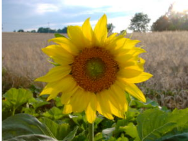
L'huile fournie par les graines du tournesol fait partie des biocarburants.

trole dans les transports routiers en 2005 : 1,6 milliards de tonnes.