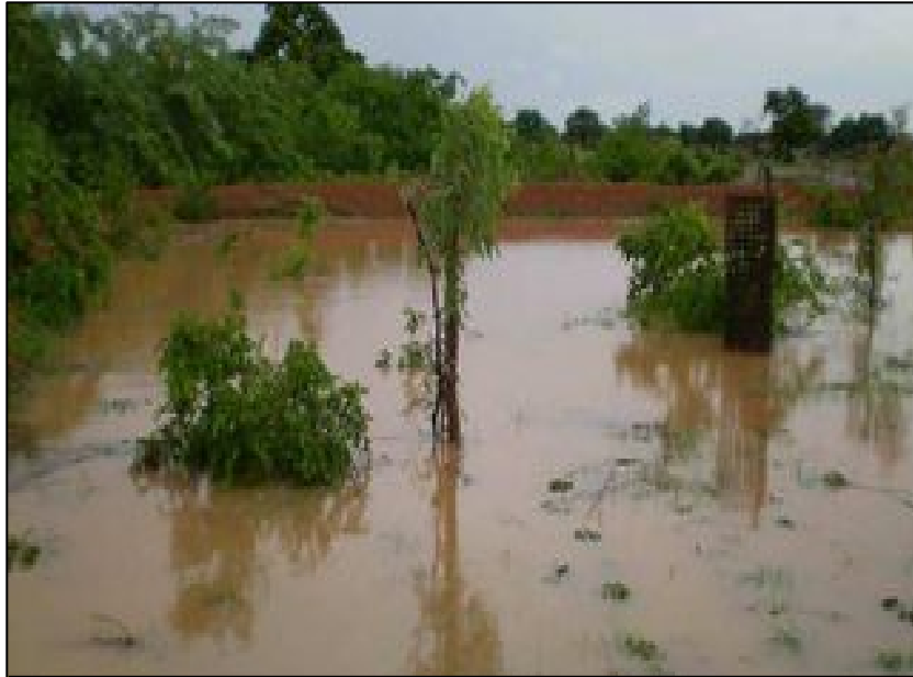
Inondations au nord du Burkina Faso en 2007