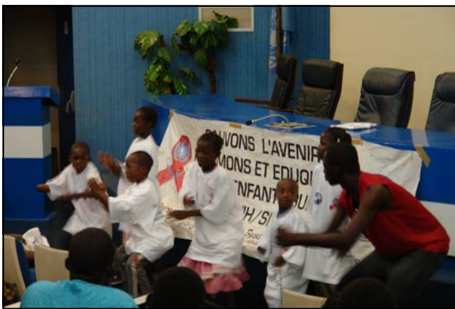
Une séance de sensibilisation avec les enfants du personnel

Il y a plusieurs examens de charges virales en utilisation en ce moment. Chaque examen utilise une technique différente pour mesurer le nombre de particules de VIH, mais tous les examens sont également valides pour déterminer si votre charge virale est basse, moyenne ou élevée.