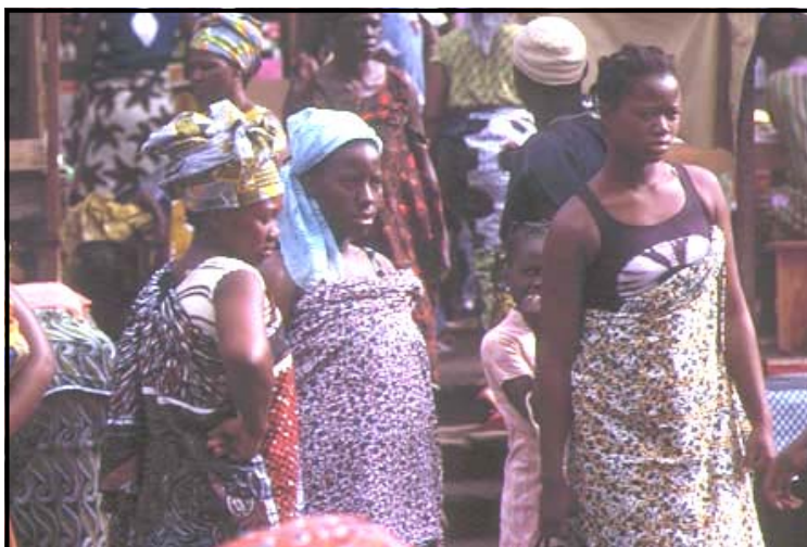
Des jeunes filles et femmes africaines

Même si le taux d'emploi des femmes a tendance à augmenter dans l'absolu, celles-ci continuent d'occuper 60 pour cent des emplois informels ou non-rémunérés. Bien