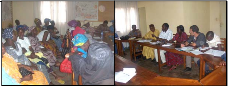
Les présidentes des Associations de pré collecte et les membres des comités

ciations pour les démarches administratives qui ont permis à celles-ci de passer du statut d'associations à celui de Groupement d'Intérêt Economique (GIE). Ces associations ont pu maîtriser mieux leurs activités, disposer de matériel et acquérir de nouvelles infrastructures. En effet, ce sont : 120 personnes formées aux techniques d'animation et de sensibilisa-