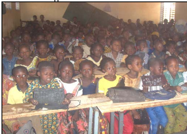
Les 185 élèves de la classe de CP2 Ecole A du Bloc scolaire NIENETA de la Commune de Bobo-Dioulasso ont des bénéficiaires directs du projet

tion dont 60% de femmes ; 80 personnes formées en hygiène et amélioration du cadre de vie dont 60% de femmes ; 80 personnes formées aux techniques de gestion et conduite des opérations de pré collecte dont 50% de femmes. Signalons que les trois (3) groupements ont reçu chacun 02 charrettes à traction asine, 01 lot de petit outillage, 01 lot de matériel de protection et 01 hangar.