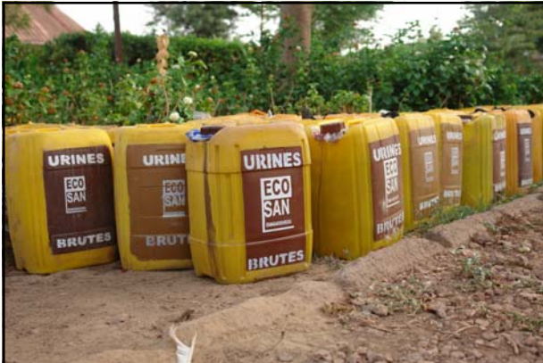
Après un mois de stockage, ces urines pourront être utilisées comme engrais dans l'agriculture

L'assainissement écologique permet d'éliminer les pathogènes dans l'excréta et de récupérer les éléments fertilisants. Des latrines qui séparent les urines et les fèces facilite le traitement et permet ensuite la réutilisation dans l'agriculture.