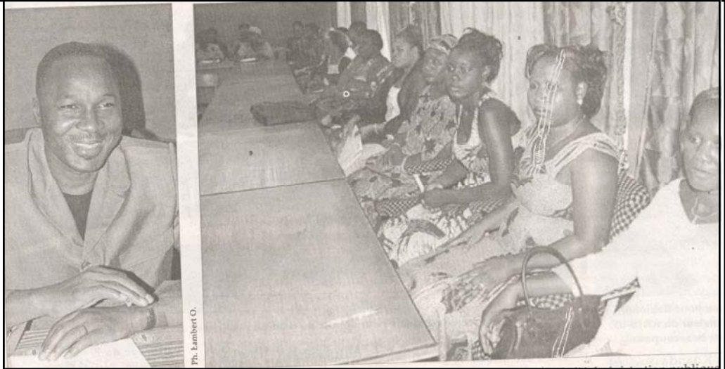
A gauche le Ministre Seydou Bouda et à droite les secrétaires, à l'ouverture du séminaire

La cérémonie d'ouverture de ce séminaire qui se déroule au sein de l'Ecole Nationale d'Administration et de la Magistrature a été présidée par le Ministre de la Fonction Publique et de la Réforme de l'Etat le mercredi 14 mai 2008. Dans son intervention, il a insisté sur les motivations qui ont prévalu à l'organisation de ce séminaire. Ces motivations tiennent aux constats faits à son arrivée à la tête du ministère. Il s'agit notamment de la faible qualité des correspondances et la diversité de présentation des correspondances soumises à sa signatures et non respect d'un certains nombre de principes de rédaction administrative.