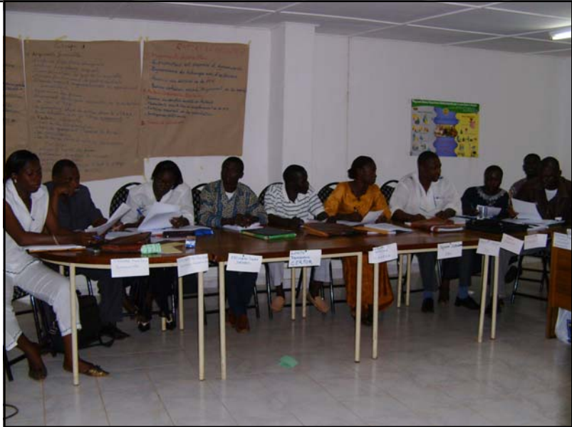
Des participants à la formation à l'EFP

C'est donc pour mettre à la disposition des futurs bénéficiaires des plates-formes techniquement fiables, économiquement rentables et socialement intégrées que l'Unité de