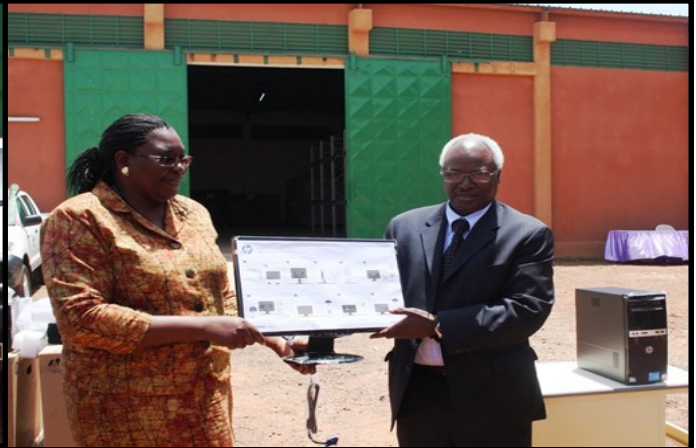
Les équipements remis permettant le démarrage effectif du projet

Depuis quelques années le Burkina Faso a enregistré de façon récurrente des catastrophes qui ont révélé la vulnérabilité des populations et la capacité limitée des institutions nationales chargées de la gestion des catastrophes.