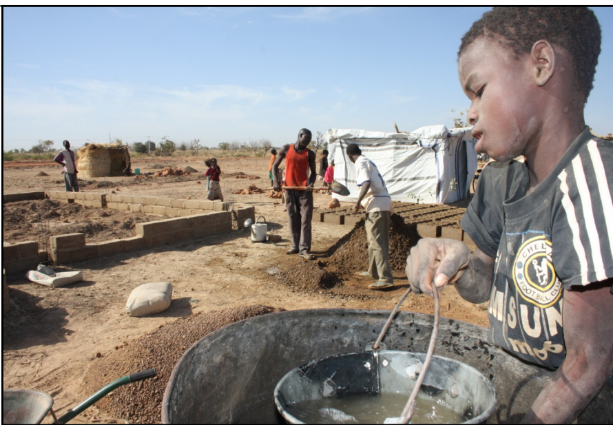
Des sinistrés de septembre 2009 se réinstallent à Yagma

Nous ne pouvons également pas faire l'impasse sur la journée Inter-