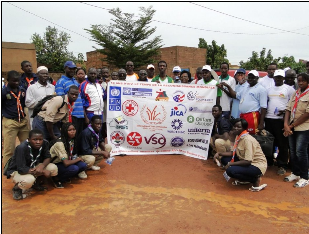
Les participants à l'opération bosquet AIV+10

Faso. C'est un acte écologique visant à promouvoir un cadre de vie propice et un développement durable.