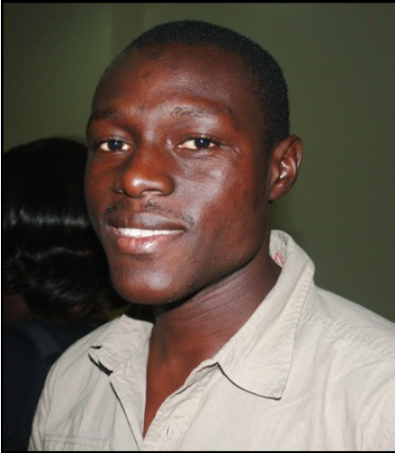
la jeunesse est le fer de lance du processus démocratique

ceux d'ailleurs sur la participation ; cela représenterait une occasion de renforcer nos connaissances et notre expérience locale.