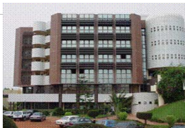
Immeuble des Nations Unies

En vue justement de motiver son staff, le PNUD a marqué le pas en adoptant de nouvelles politiques de reconnaissance et de récompense et coaching de ses employés. Il s'agit en fait de sou-