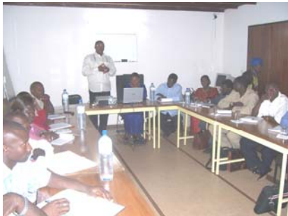
Une séance de formation

L'Unité Centrale d'Appui à la Coordination et à la Gestion des Programmes et Projets sous Exécution Nationale communément appelée UNITE NEX, est un projet placé sous l'égide du Ministère des Finances et du Budget et dont la principale fonction est d'assurer le renforcement des capacités nationales, de former et de mettre en place un noyau de professionnels requis pour rendre l'assistance au développement plus efficace, plus orientée vers des objectifs précis de développement et moins coûteux.