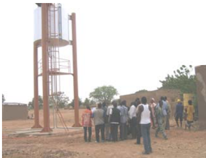
Les journalistes lors de la visite d'ouvrages

rience de Tin Tua dans l'implantation des plates-formes à l'Est - les