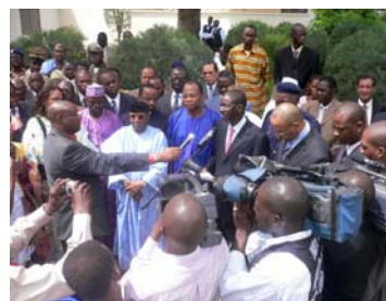
Les autorités répondent aux journalistes

cité pour apporter son appui technique pour le lancement de ce grand projet notamment