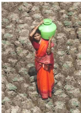
L'eau doit être une responsabilité partagée.

( http://www.worldwaterweek.org/index.asp ) La Rédaction