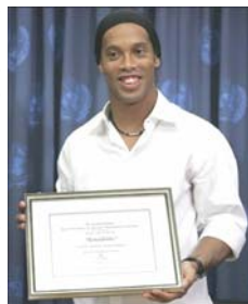
Le footballeur brésilien au siège des Nations Unies

cette fonction et porter le message des Nations Unies dans le monde», a-t-il ajouté .