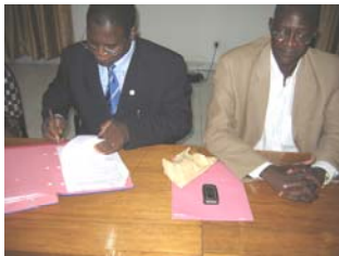
Signature de la convention

Le lundi 14 août 2006 à 15 h a eu lieu dans la salle de réunion du programme national plates formes multifonctionnelles pour la lutte contre la pauvreté une signature de convention cadre de partenariat entre le Programme National Plates Formes Multifonctionnelles pour la Lutte Contre la Pauvreté (PN-PTF/LCP), la Banque Régionale de Solidarité (BRS) et la Fédération Nationale des Cais- ses Populaires FNCP).