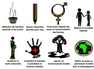
Des icônes représentant les objectifs du millénaire

cessaires à l'atteinte de ces objectifs. L'atelier organisé à Tenkodogo a permis à la DGEP de présenter aux différents ministères sectoriels réunis l'état des lieux dans la mise en oeuvre des OMD au Burkina Faso et de préciser l'agenda futur. A l'issue des travaux de l'atelier, des directives nationales pour l'accélération de l'atteinte des OMD devraient être discutées et adoptées. Le bilan positif qui peut être tiré de cet atelier (qualité des présentations, logistique jugée satisfaisante, nombre élevé de participants se déclarant prêts à engager l'exercice d'évaluation des besoins dans leur secteur et disponibles pour assurer une formation) permettra d'approfondir cet exercice dans un proche avenir." Nicolas Ponty